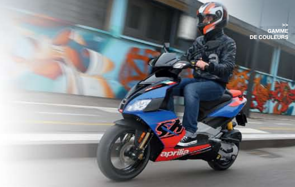
>> GAMME DE COULEURS