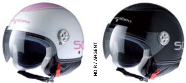
NOIR / ARGENT