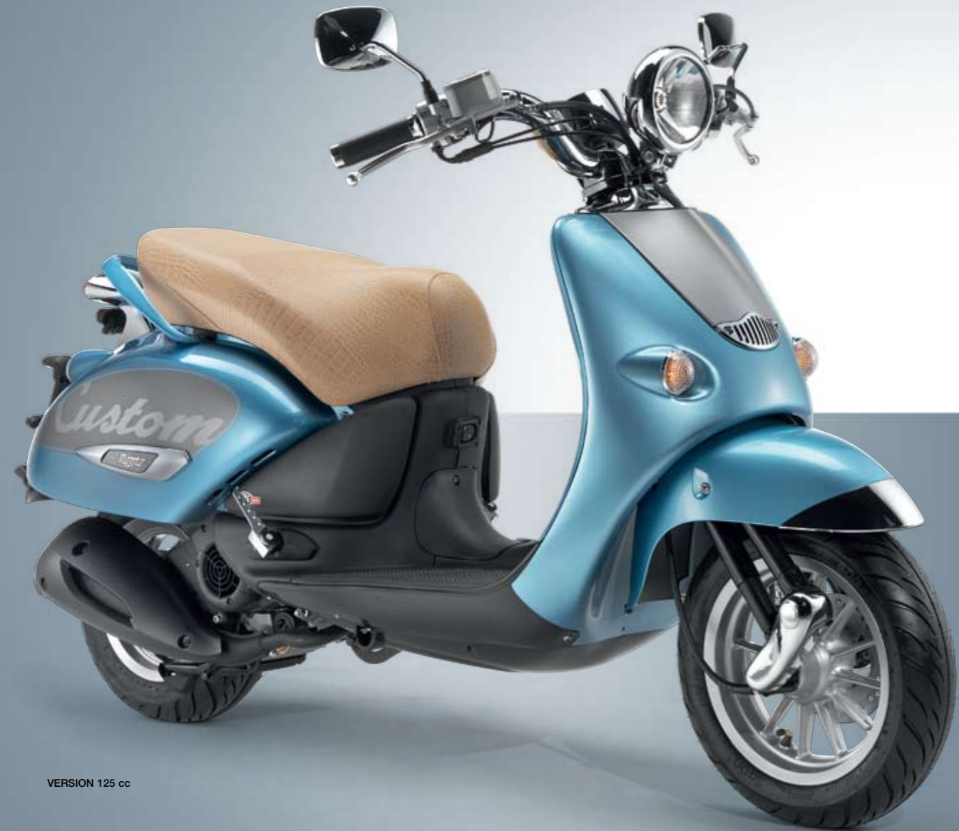
VERSION 125 cc