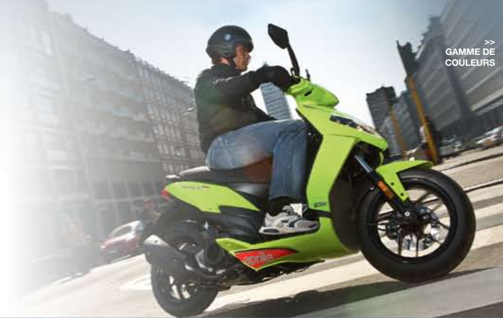
>> GAMME DE COULEURS